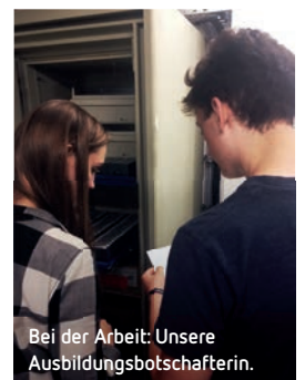
Bei der Arbeit: Unsere Ausbildungsbotschafterin.

common solutions schickt gleich zwei „Ausbildungsbotschafterinnen“ für Bochum ins Rennen. Auf Augenhöhe berichten sie vor Schulklassen von ihren Erfahrungen in der Ausbildung. S4