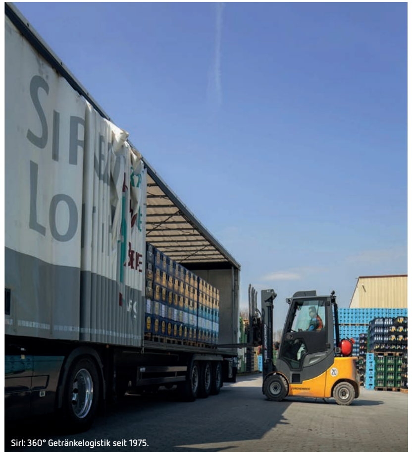
Sirl: 360° Getränke Logistik seit 1975.

Redaktion: Vielen Dank, dass Sie sich die Zeit genommen haben. Wir wünschen Ihnen, dass der Erfolgskurs der Sirl Interaktive Logistik GmbH weiterhin in diesem Maße anhält. Die Zusammenarbeit bleibt sicher spannend.