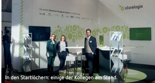
In den Startlöchern: einige der Kollegen am Stand.

Nach drei Messetagen waren einige Kollegen ein wenig heiser. Nicht weiter schlimm, das lag schließlich an den vielen guten Gesprächen.