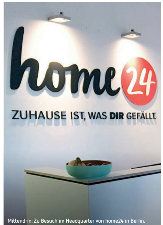
Mittendrin: Zu Besuch im Headquarter von home24 in Berlin.

Weniger cool war hingegen die Tatsache, dass wir unsere Kamera-Drone nicht einsetzen konnten. Um die enorme Größe des Logistikzentrums zu zeigen, waren eigentlich Luftaufnahmen geplant. Sturmtief Friederike hat uns da aber leider einen Strich durch die Rechnung gemacht. Trotz aller Bemühungen und unzähliger Aufbauversuche mussten wir uns irgendwann eingestehen: Bei Orkanböen dieser Stärke ist an einen Drohnenflug nicht zu denken! Zu diesem Zeitpunkt war uns allerdings noch nicht klar, dass